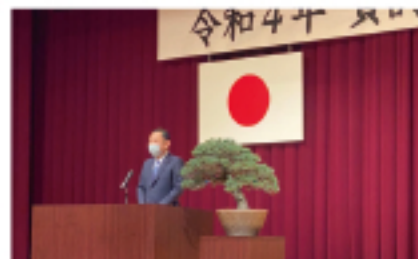
●2022.1.4 清水町の令和4年賀国交協会に参加