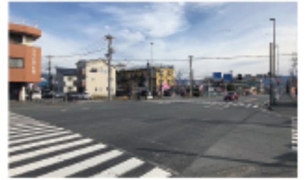
●「沼津三島線」八幡交差点