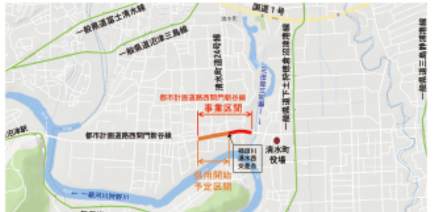
●「西間門新谷線」位置図