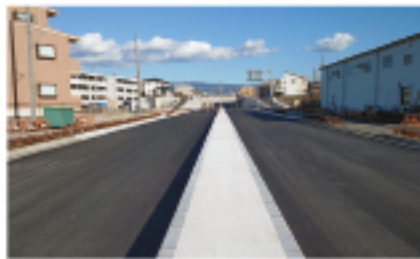
●「沼津三島線」起点付近

●「三島富士線」は幅員狭小のうえ線形も悪く、慢性的な交通渋滞を引き起こし、また車輛との幅員により歩行者・自転車の通行に支障をきたす状況のため、本路線を主要地方道三島富士線のバイパスとして整備しています。