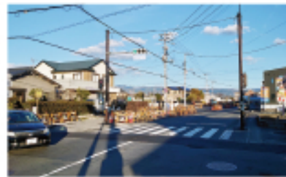
●「西間門新谷線」暫定供用起点

●「西間門新谷線」柿田交差点から榎木田交差点区間は、見通しの悪いS字カーブ等での事故が毎年発生している状況のため整備して、交通環境の改善を図ろうとするものです。