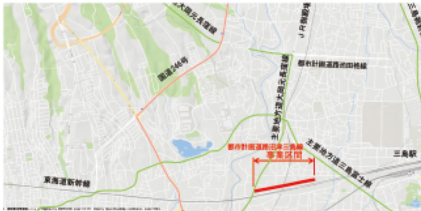
●「沼津三島線」位置図