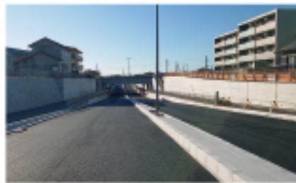
●「沼津三島線」JRアンダー東側