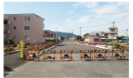
●「西間門新谷線」暫定供用終点付近