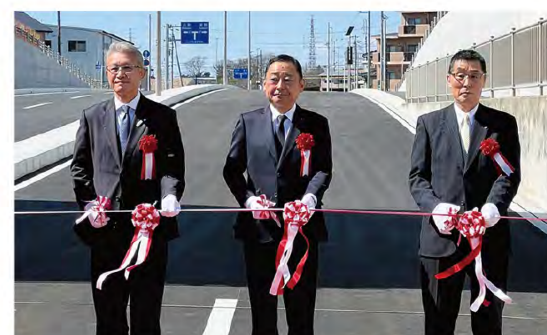
●2022.3.6 長泉町内「都市計画道路、沼津三島線」開通式に参加