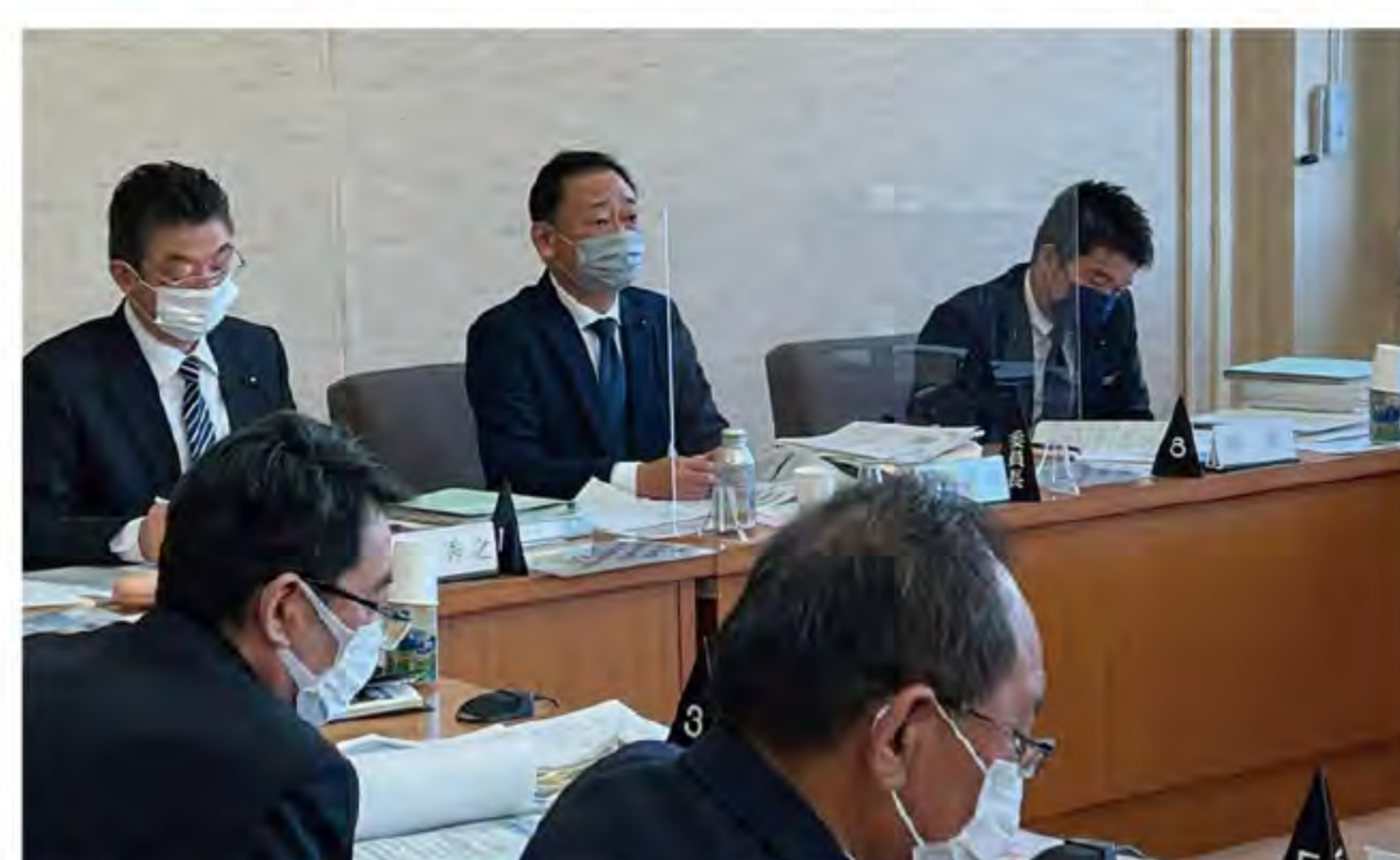
●2022.3.9 県議会建設委員会・交通基盤部及び収用委員会関係の審査をする