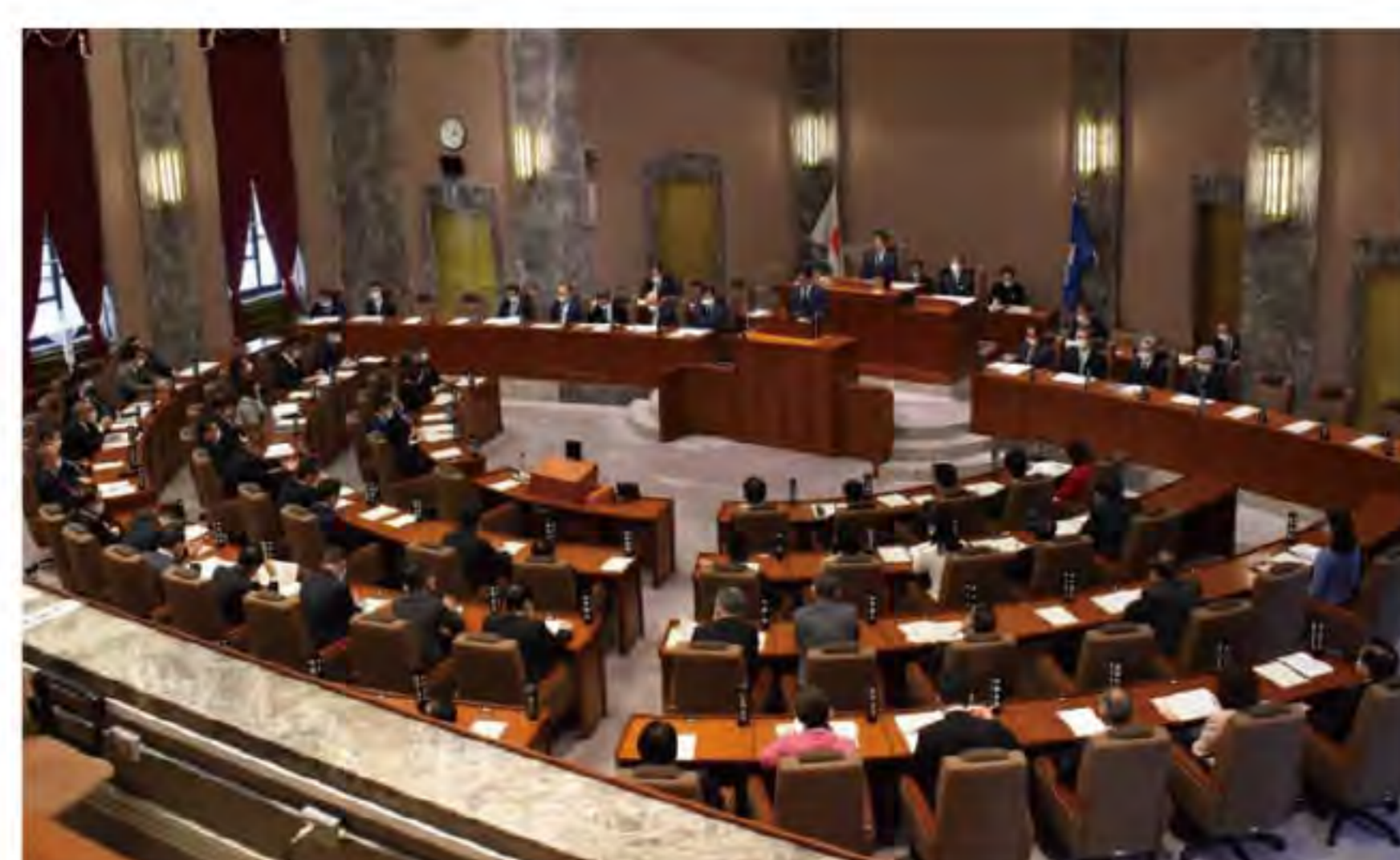
●2022.2.4 県議会2月臨時会が開かれる・まん延防止等重点措置適用等に伴い必要となる経費の補正予算を議決