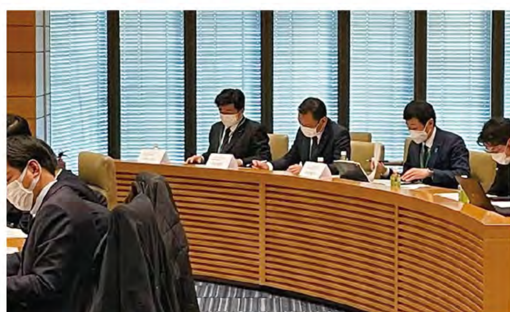
●2022.3.7 「JR・私鉄沿線市町利便性向上対策連絡会」総会のため衆議院第一議員会館国際会議室に向う