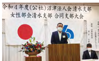
令和4年度(公社)沼津法人会清水支部 女性部会清水支部 合同支部大会 ●2022.5.23 「沼津法人会清水支部・沼津法人会女性部会清水支部合同支部大会」に参加