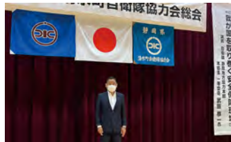
●2022.7.3 「令和4年度第46回清水町自衛隊協力会総会」に参加